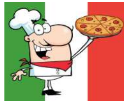
Italienischer Morgen, 29. August