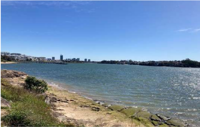
Café Besuch in Cabarita Park 15. August 2022