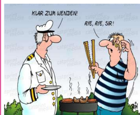
WENN SEGLER GRILLEN

Ca. 10 Minuten später: "Und was machen wir jetzt mit dem Hund?"